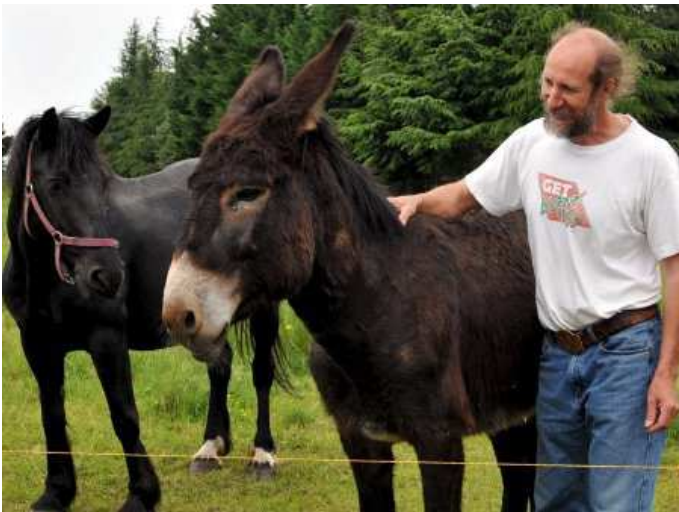
Mission pour l'âne et la jument : l'entretien des espaces verts.

"Ulysse" a changé de Pénélope. Elle s'appelle "Volga" et tous deux vacquent actuellement au nettoyage de leur espace de vie avant de gagner d'autres eldorados où l'herbe est abondante... A Villardonnel, sur la route de Cuxac, l'âne "Ulysse" et la jument merens "Volga", broutent allègrement dans le champ de Fernand Pachon. Une fois ce garde-manger de près d'un hectare ratiboisé, le couple filera dans le jardin de Michelle, une petite mamie de 80 ans. Ils feront bombance, aussi, sur les espaces communaux. Des agapes grand luxe: le village compte près de 25ha publics. Certes, quelques bois y sont disséminés mais, pour l'essentiel, de la verdure bien grasse s'offre aux estomacs de ces animaux.